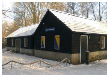
Het huidige gebouw (Nicolaas)

Ons 32 jaar oude houten gebouw voldoet niet meer aan de moderne gebruikseisen. Met een nieuw gebouw, geven wij weer de uitstraling en mogelijkheden die bij onze groep horen en aantrekkelijk zijn voor nieuwe leden. Onze spelruimte is beperkt, nu de gemeente een groot gedeelte van onze speelruimte aan onze buurman (campinghouder) heeft geschonken. De gewenste uitbreiding van deze grond tot kwaliteitscamping is van invloed op onze scoutingactiviteiten.