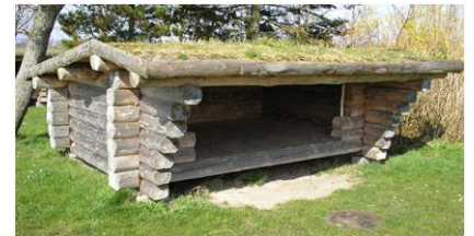
Impressie shelter (Denemarken)

Het spel- en kampeerveld wordt wekelijks gebruikt voor de jongste groepen voor spelactiviteiten. Twee shelters als nachtonderkomen voor scouts, worden aan de rand van het terrein geplaatst. Wij stellen de verhuur van het terrein beschikbaar aan belangstellenden en voor activiteiten die passen binnen de bestemming van een scoutingterrein.