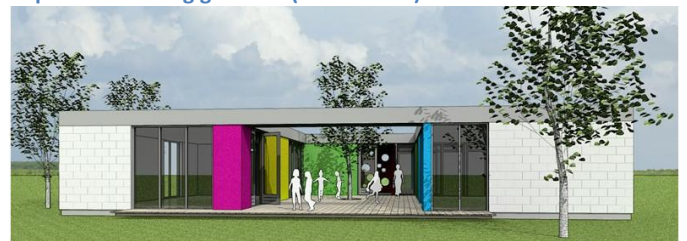
Impressie scouting gebouw (Tasta bouw)

Op het bebouwd terrein stippelen wij een locatie uit voor ons scoutinggebouw, met vijf groepsruimten voor acht speltakken en een logiesfunctie. Daarbij komen bijgebouwen zoals: botenloodsen, blokhut, kampvuurkuil, buitenopslag voor pioniermateriaal, drie vlaggenmasten en een fietsenstalling. Het scoutinggebouw zal ruimte bieden aan scoutingactiviteiten met overnachtingsmogelijkheid. De inrichting zal voldoen aan de gestelde eisen op dit gebied, inclusief de gebruikseisen voor mindervalide scouts. Voor de jongste speltak organiseren wij kampen in ons gebouw, naar de normen van Scouting Nederland. Het gebouw willen wij ook aanbieden voor medegebruik van vaste huurders. De verhuur van het gebouw stellen wij open voor vakanties met minder validen.