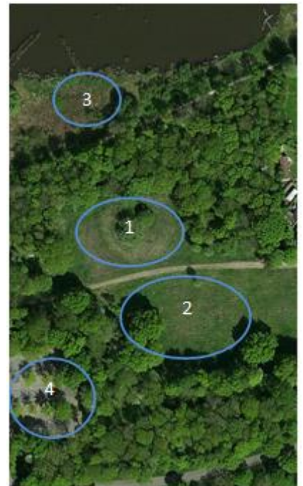
Het scoutingterrein (Digital Globe)

Op het bebouwd terrein stippelen wij een locatie uit voor ons scoutinggebouw, met vijf groepsruimten voor acht speltakken en een logiesfunctie. Daarbij komen bijgebouwen zoals: botenloodsen, blokhut, kampvuurkuil, buitenopslag voor pioniermateriaal, drie vlaggenmasten en een fietsenstalling. Het scoutinggebouw zal ruimte bieden aan scoutingactiviteiten met overnachtingsmogelijkheid. De inrichting zal voldoen aan de gestelde eisen op dit gebied, inclusief de gebruikseisen voor mindervalide scouts. Voor de jongste speltak organiseren wij kampen in ons gebouw, naar de normen van Scouting Nederland. Het gebouw willen wij ook aanbieden voor medegebruik van vaste huurders. De verhuur van het gebouw stellen wij open voor vakanties met minder validen.